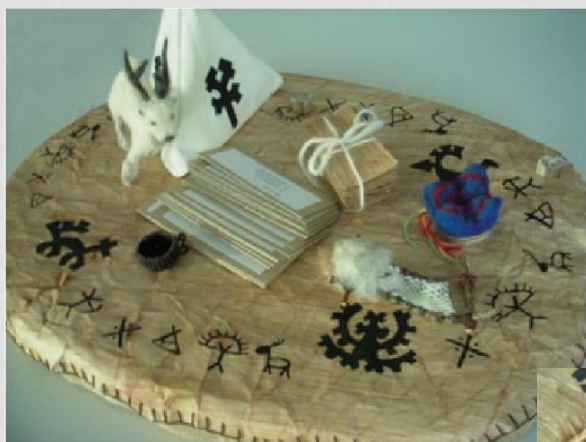
• Lapin luontopeli